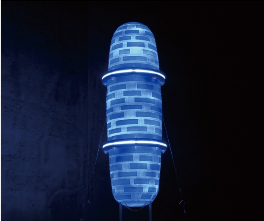
輝器 KAGAYAKI - COCOON