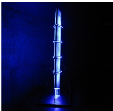
輝器 KAGAYAKI - 斬 ZAN / h88×w17×d10cm / ミクストメディア・信楽透土、青色LEDライト